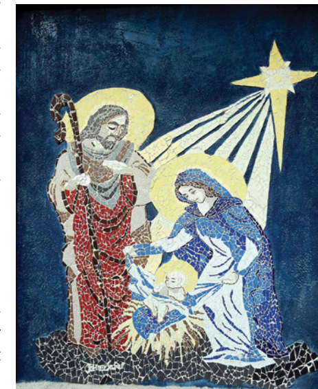
Geburt Jesu – Mosaik an Hauswand in Bethlehem.

Und plötzlich war bei dem Engel ein großes himmlisches Heer, das Gott lobte und sprach: „Verherrlicht ist Gott in der Höhe und auf Erden ist Friede bei den Menschen seiner Gnade!“