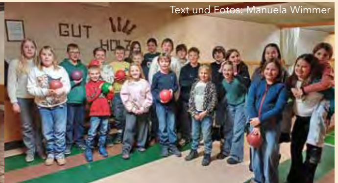
Text und Fotos: Manuela Wimmer

BERNDORF: Am 2. und 3. Jänner 2026 wurden beim Sternsingen 6.527 Euro in unserer Pfarre gesammelt. Das ist eine wertvolle Unterstützung und ein starkes Zeichen von Solidarität mit Menschen, die von Armut, Hunger und Ausbeutung betroffen sind.