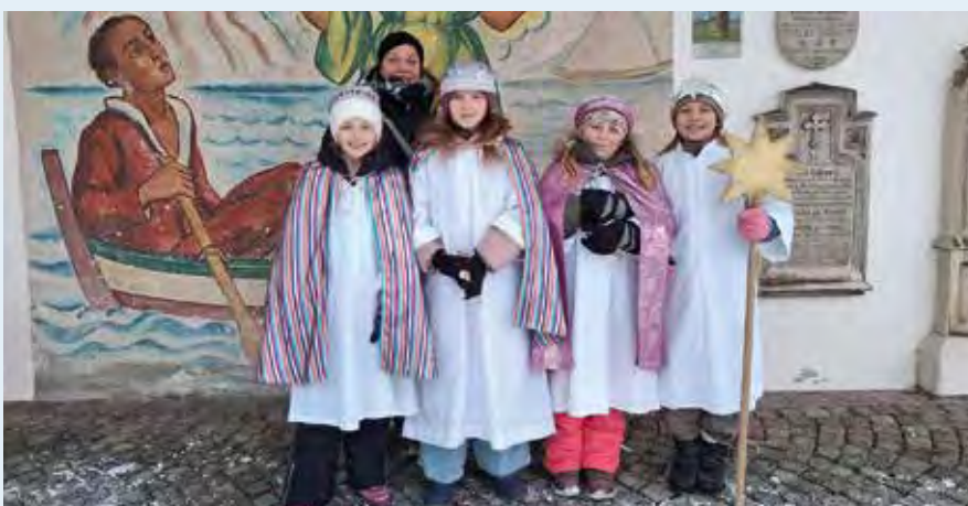
Text und Foto: Christina Bürtlmair

SEEHAM: Mit großem Eifer und Begeisterung waren fast 50 Kinder und Jugendlichen am 3. und 5. Jänner 2026 in Seeham unterwegs und haben für Menschen gesammelt, denen es nicht so gut geht wie uns. Es konnte ein stolzer Betrag von 7.679,63 Euro gesammelt werden.